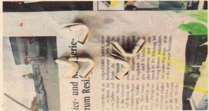
So sollte die Munition aussehen.